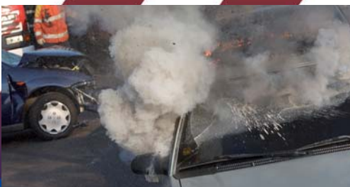
Als elke seconde telt!