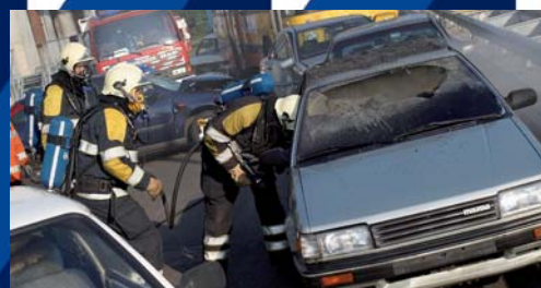
Vervolgschade blijft beperkt