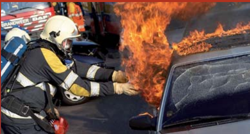
Actieve bestrijding bij brand

■ activeert zichzelf ■ eenvoudig in gebruik ■ geringe afmeting en gewicht ■ werkt direct bij contact met open vuur ■ voor binnen- en buitenbranden ■ vervolgschade blijft beperkt ■ geen onderhoudskosten ■ inhoud is mens-, dier- en milieuvriendelijk ■ 5 jaar garantie.